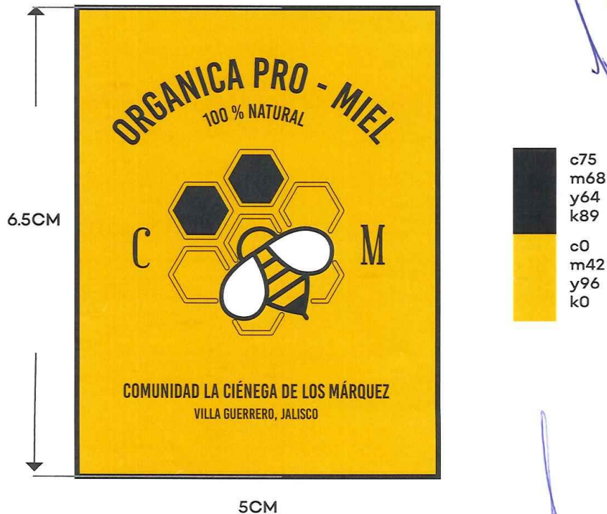
Pre-suajadas con logotipo