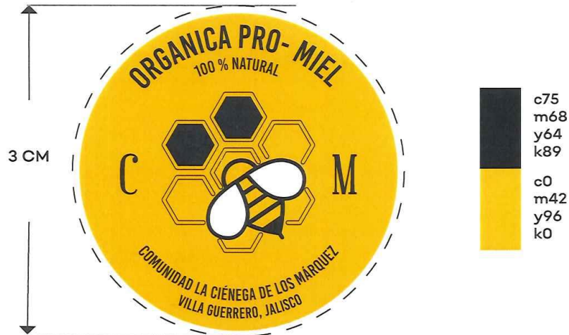
Pre-suajadas con logotipo